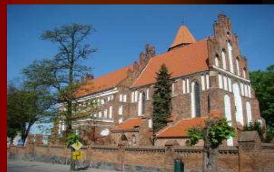
KOŚCIÓŁ W RADZYNIU CHEŁMIŃSKIM