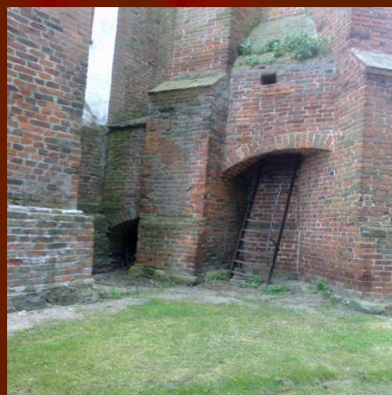
METALOWA DRABINA W KOŚCIELE W RADZYNIU CHEŁMIŃSKIM