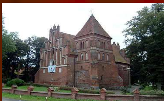
KOŚCIÓŁ W OKONINIE