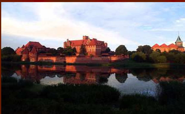
ZAMEK - MALBORK