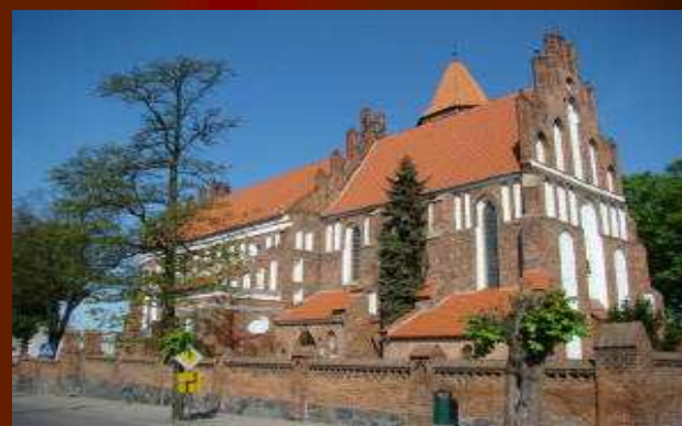
KOŚCIÓŁ - OKONIN