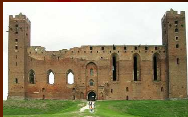
RUINY ZAMKU - RADZYŃ CHEŁMIŃSKI